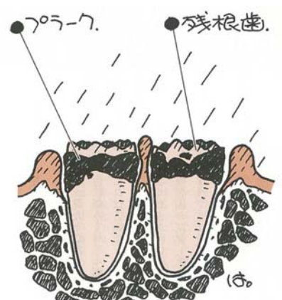
※磨きにくく、食べかすがたまりやすい!!