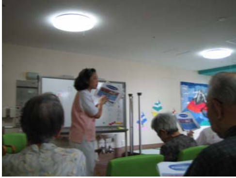
皆さん説明より配布した口腔ケア資料に夢中ご様子でした。一緒にお配りした歯ブラシを嬉し