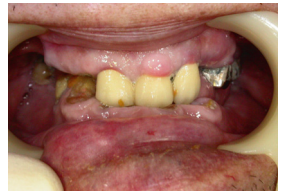
歯周病は歯の欠損など様々な弊害を誘発します。